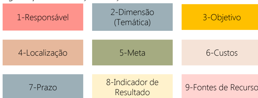
Figura 1 – Categorias para identificação das ações do PAI

Neste documento constam as estimativas de custos de instalações e implantação de programas e projetos para os próximos 5 (cinco) anos e a compatibilidade destes custos com a projeção orçamentária. Desta forma, a identificação de cada ação do PAI é feita em 9 (nove) categorias, de acordo com a Figura 1 e foram distribuídas em um horizonte de exequibilidade em curto, médio e longo prazo, conforme Figura 2.